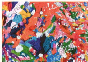
「公子の世界 2012」 大槻 公子(あかとき学園)