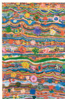
「はなのえ きれいなはなもよう」 中谷 洋子(アート活動支援室びかり)