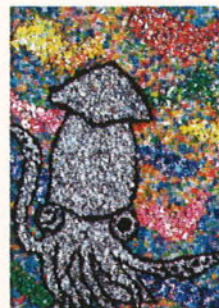
「イカール星人」 チームかいせい (かいせい第3海星ふっと)