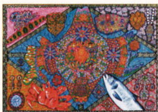
「宝石より美しき北海道」 酒井 理英子(サポートインサッポロ)