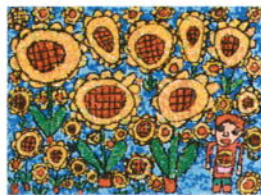
「向日葵」 チームかいせいO (かいせい第3海星ふっと)